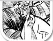
Z1 einfache Zeichnung