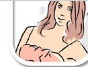
L5 vektor Pinsellinien (Mode)