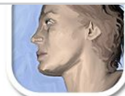
G4 digital Malen