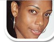
F5 ausgeleuchtet (Flash)