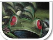
G2 echt, plus Kreide