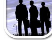
R5 Siluetten, viel Schatten