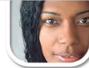
F4 weiches Licht