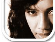
F3 mittelhartes Licht