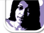
F6 Foto Farbreduktion