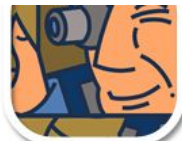
L7 dicke Linien, Jugendstil