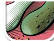
Z9 vektorisiert, zacken