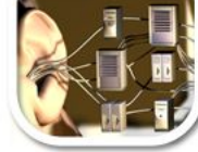
R4 realitätsferne Situation