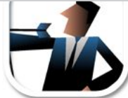
FV2 viel Schwarz