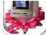
F8 Foto Retouche