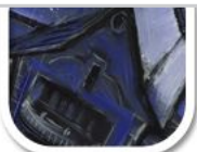
G3 schwarzes Papier plus Kreide