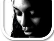
F2 hartes Licht