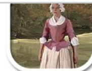
G6 nachbearbeitetes Foto