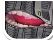
F9 Foto Manipulation