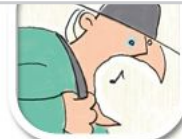
Z4 koloriert, naïv, frech