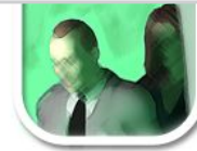
F8 nachbearbeitet (Malstil)