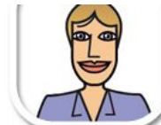
L8 dicke Linien, naïv