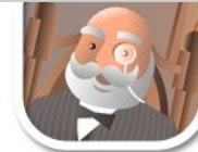
FV4 kein Schwarz