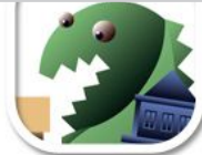
FV3 wenig Schwarz