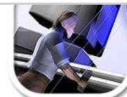
G5 nachbearbeitetes 3d