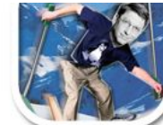
F10 Foto Collage