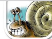
Z5 koloriert stark nachbearbeitet