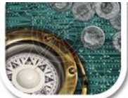
F7 Foto Komposition