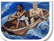
G1 echt Akryl