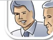
L4 real mit Verläufen