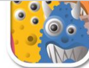
FV6 frech und bunt