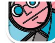
L10 dick, frech und cool